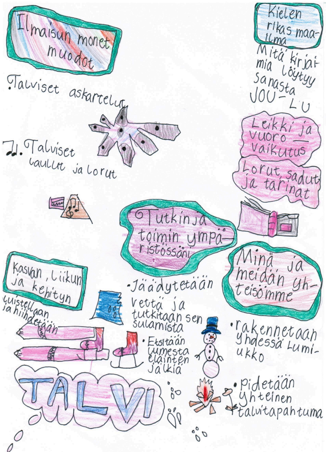
Yllä oleva kuva havainnollistaa, miten eri oppimisen alueet ovat läsnä, kun lapsia kiinnostaa talven ilmiöt. Yhtä lailla käsittelyssä voisi olla vaikkapa avaruus, ötökät tai supersankarit.